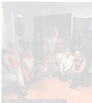
Alcuni componenti del Gruppo «Il cestino»

Per ricordare uno degli errori giudiziari più clamorosi della storia italiana, il cosiddetto caso Tortora, si tiene mercoledì 27, alle 17.30, nella Sala Bolognini del Convento San Domenico (Piazza San Domenico 13), l'incontro con l'avvocato Raffaele Della Valle e lo scrittore Francesco Kostner, autori di «Quando l'Italia perse la faccia. L'orrore giudiziario che travolse Enzo Tortora», un libro-intervista che ricostruisce la vicenda giudiziaria di Tortora, accusato di far parte della Nuova camorra organizzata con un ruolo di primo piano nel traffico della droga. Intervengono Francesca Scopelliti, presidente della Fondazione internazionale per la giustizia «Enzo Tortora», Maria Grazia Nati, presidente GIP del Tribunale di Bologna, Nicola Mazzacava, docente presso l'Alma Mater e presidente della Camera penale di Bologna e il giornalista Oscar Giannino. Moderatore l'incontro il magistrato Stefano Dambrosio, il coordinamento dell'iniziativa è di Francesco Cardile, avvocato del Foro di Bologna.