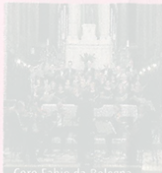
Coro Fabio da Bologna