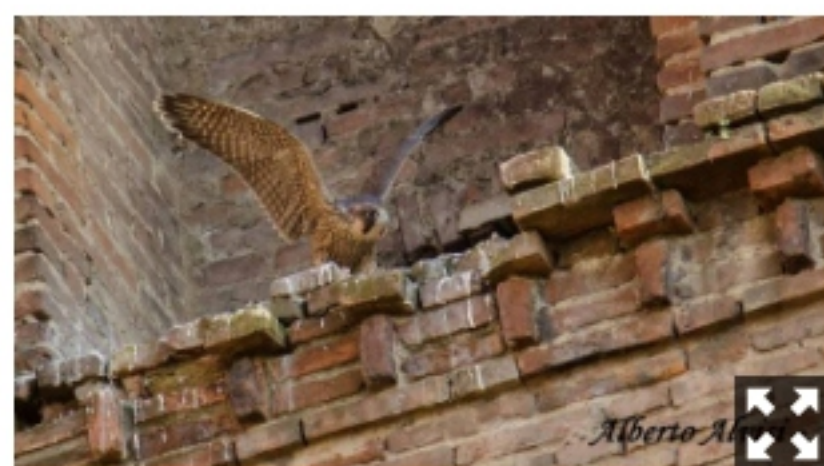
Nella foto di Alberto Alvisi il nido dei falchetti in San Petronio

Bologna, 29 maggio 2016 - Ha deciso che era giunto il momento di cimentarsi in salto nel vuoto, in tutti i sensi, così ha lasciato i fratellini nel nido, in cima alla Basilica di San Petronio , e ha spiccato il volo.