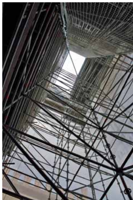
Particolari del sistema di ancoraggio. Gli ancoraggi "primari" sono stati realizzati utilizzando le Buche Pontaie lasciate nella facciata dai Costruttori nel lontano 1600

La realizzazione del ponteggio per il restauro della facciata è stato un intervento complesso, ed ha richiesto l'applicazione di tecniche innova-