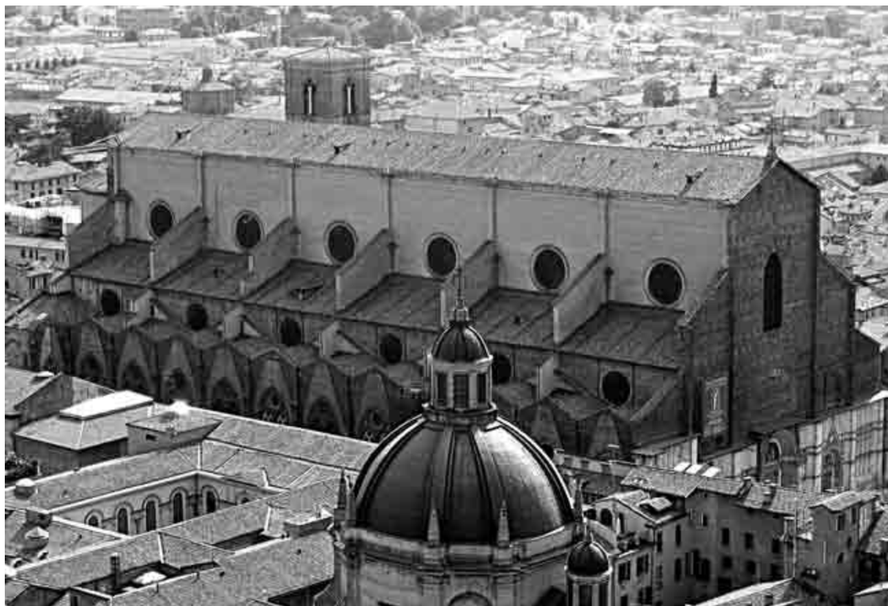
Fig. 1 – Bologna, basilica di San Petronio: in evidenza la terminazione superiore della navata centrale.

Il diretto intervento di Sisto V nel cantiere petroniano si attuò all'inizio del suo pontificato a seguito di un fatto di sangue che fece molto scalpore: l'uccisione nell'agosto 1585 del conte Giovanni