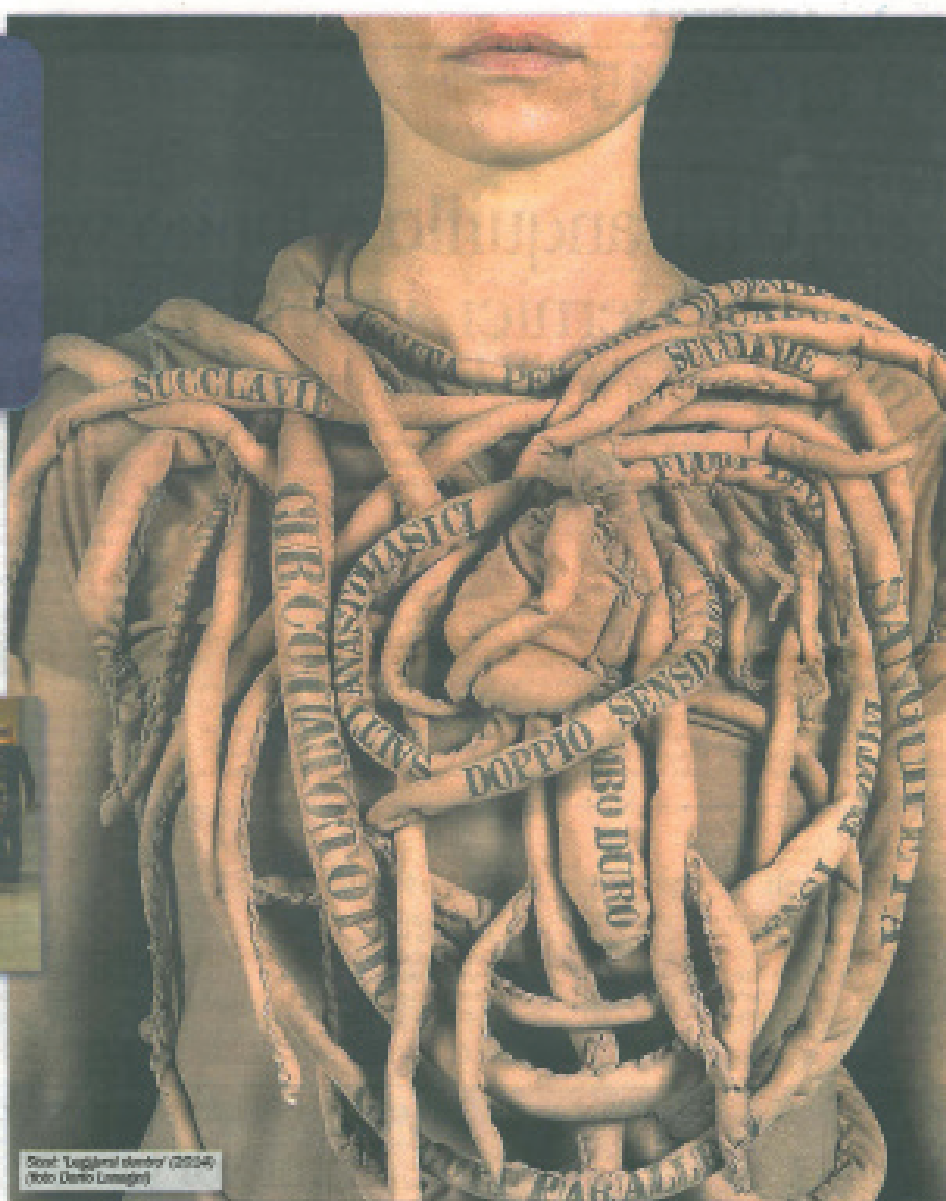
Scat. "Leggimi stender" (2014)